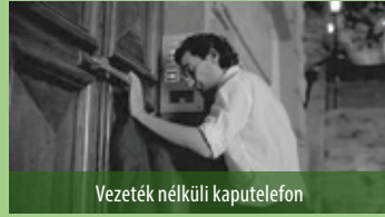
Vezeték nélküli kaputelefon