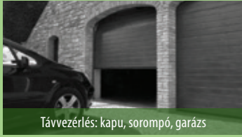
Távvezérlés: kapu, sorompó, garázs