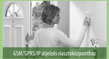
GSM/GPRS/IP átjelzés riasztóközpontoz