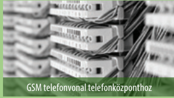
GSM telefonvonal telefonközpontoz