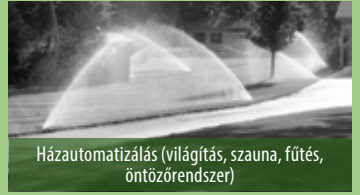
Házautomatizálás (világítás, szauna, fűtés, öntözőrendszer)