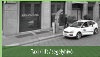
Taxi / lift / segélyhívó