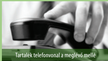
Tartalék telefonvonal a meglévő mellé